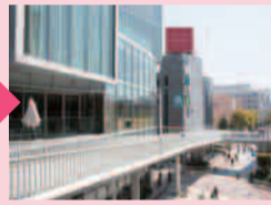
枚方 T-SITE を過ぎて