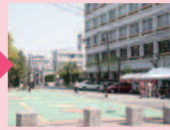
市役所前を左折。保健所の隣